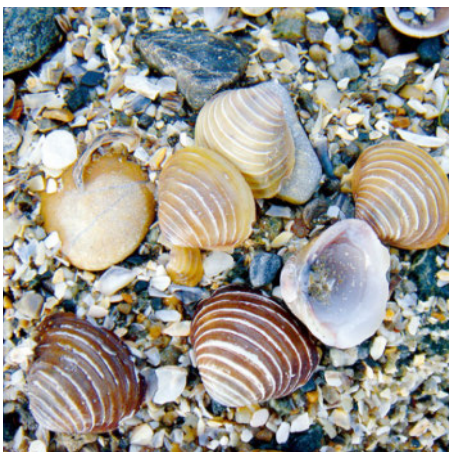
Asiatische Körbchenmuschel ( Corbicula fluminalis )

KONTAKT Gian-Reto Walther Sektion Arten und Lebensräume BAFU +41 58 462 93 64 gian-reto.walther@bafu.admin.ch