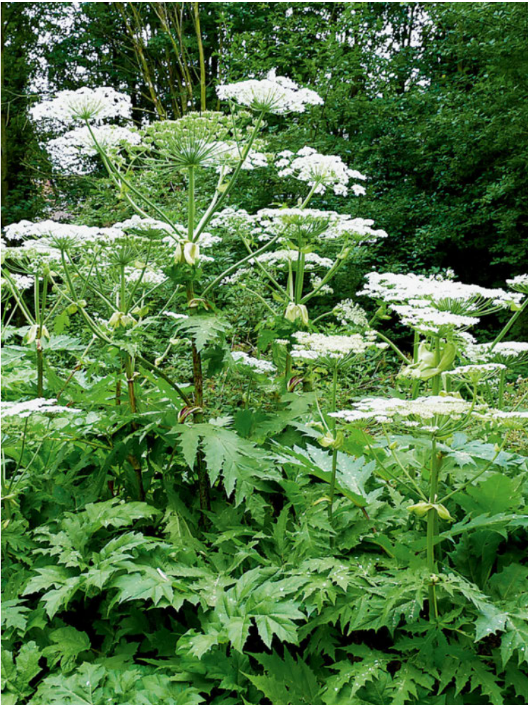
Der Riesenbärenklau ( Heracleum mantegazzianu ) gehört zu den invasiven gebietsfremden Arten.