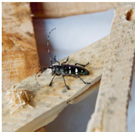
Asiatischer Lauholzbockkäfer ( Anoplophora glabripennis )