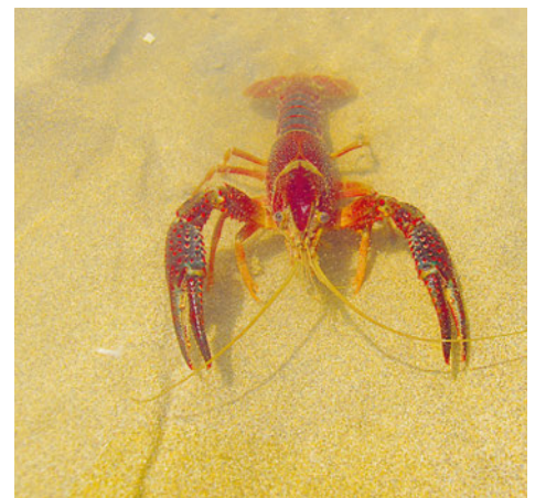
Roter Amerikanischer Sumpfkrebs ( Procambarus clarkii )