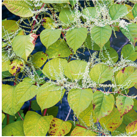
Japanischer Staudenknöterich ( Fallopia japonica )