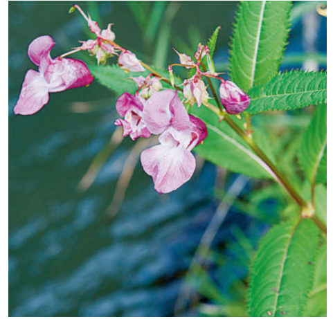
Drüsiges Springkraut ( Impatiens glandulifera )