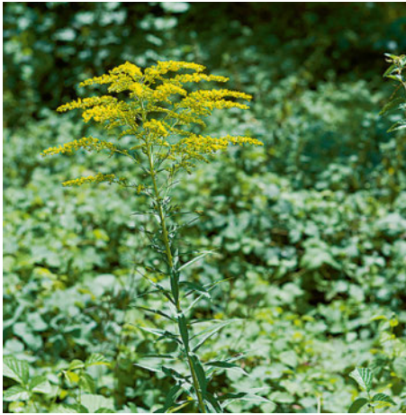
Kanadische Goldrute ( Solidago canadensis )